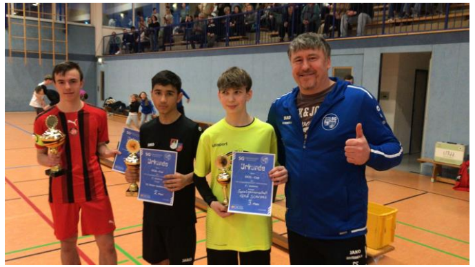
Die drei Erstplatzierten