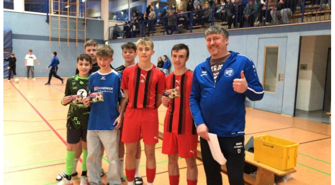
Team des Turniers und Torschützenkönig