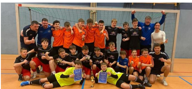
Die beiden Mannschaften der SG Langenwetzendorf/Hohenleuben.

Am Sonntag standen noch zwei weitere Turniere an, und es ging am Vormittag los mit den E-Junioren. Hier waren nur sieben statt der ursprünglich acht eingeplanten Mannschaften anwesend, also wurde im Modus Jeder-gegen-Jeden gespielt.