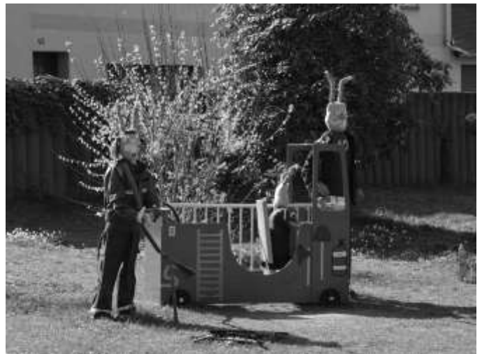
Das Highlight für die Kids: Das Osterhasen-Feuerwehrauto.