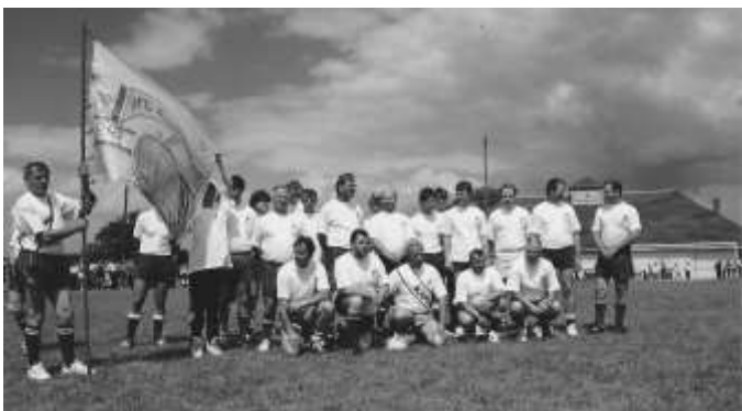
„1. FC Rosenhöhe“ gegen ...