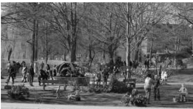
Über Ostern drängten sich die Menschen rund um den Osterbrunnen.