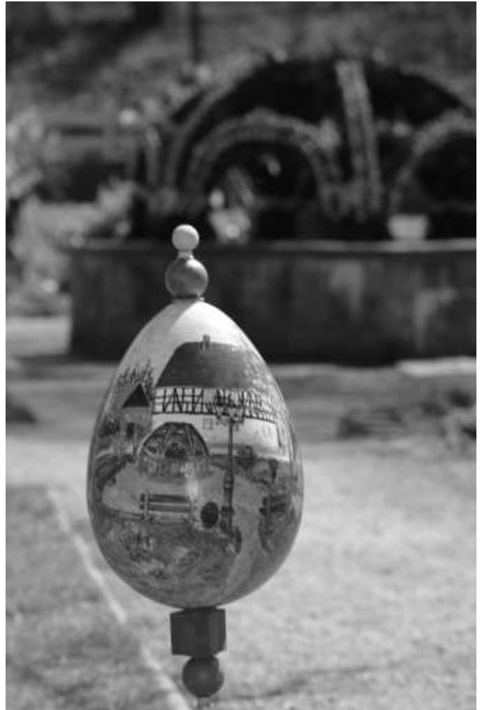
Fotografen fanden spannende Perspektiven im Osterpark.