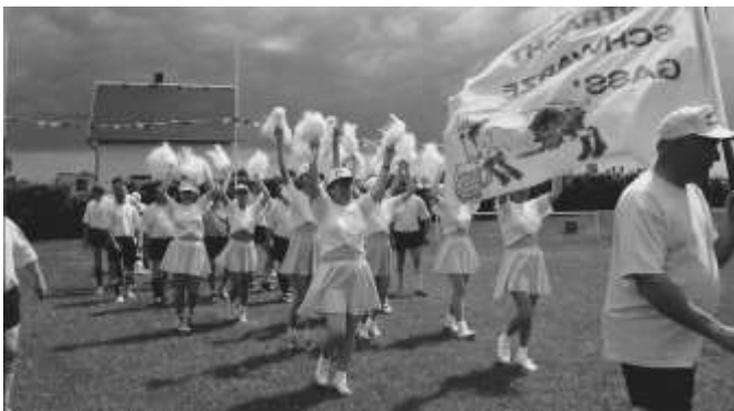
die Cheerleaders der „Eintracht Schwarze Gass“ vom Unterdorf