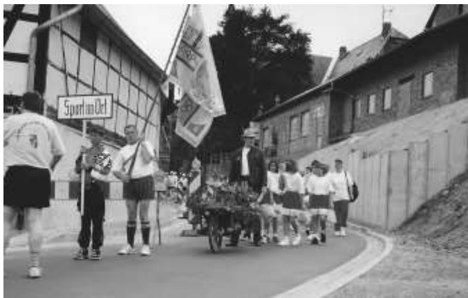
Aufstellung zum Festumzug anlässlich des 125-jährigen Sportjubiläums im Jahre 1997 am Anger

Ein Höhepunkt im sportlichen Dorfleben war die Festwoche zum 125-jährigen Jubiläum des ersten Sportvereins im Jahre 1997. Es gab einen Festumzug und in Anlehnung an die Fußballspiele zwischen Ober- und Unterdorf in den 70er und 80er Jahren formierten sich zwei Mannschaften, die mit ihren eigenen Cheerleaders auftraten und auf dem Sportplatz gegeneinander antraten.