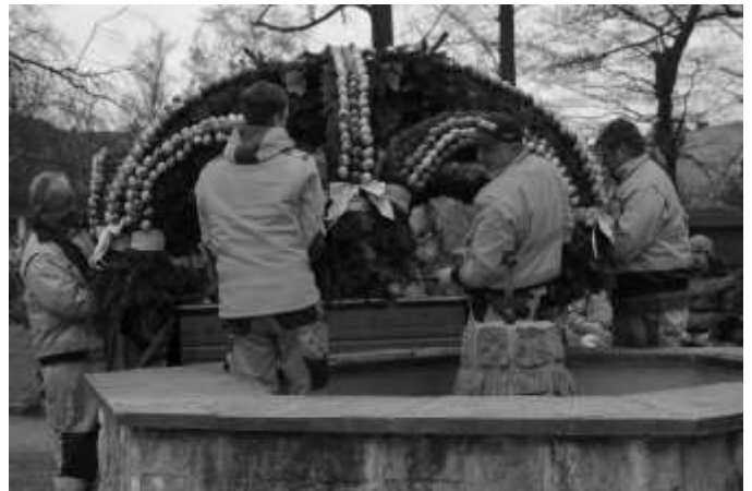
Der Bauhof hebt die Osterkronen auf den Brunnen im Park.