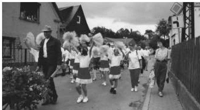
die Cheerleaders des „1. FC Rosenhöhe“ vom Oberdorf