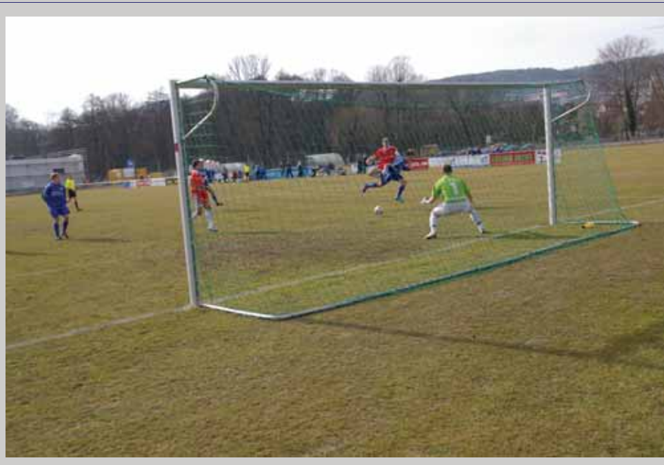
Maximilian Enkelmann erzielt gegen Heiligenstadt den 2:2-Ausgleich.